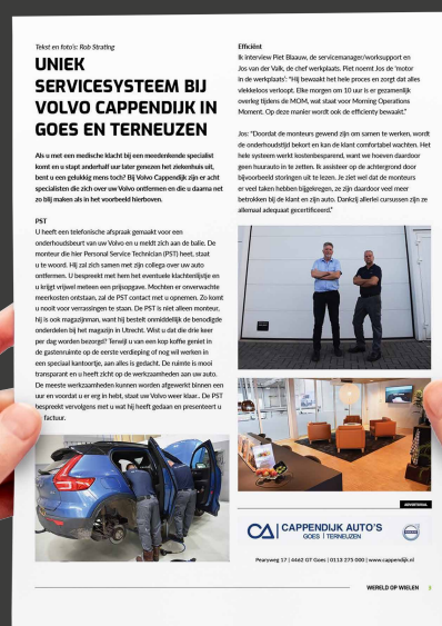
Voorbeeld advertorial op een hele pagina

✉ verkoop@quaerismedia.nl ☎ 0113 21 32 41 keuzemenu 1